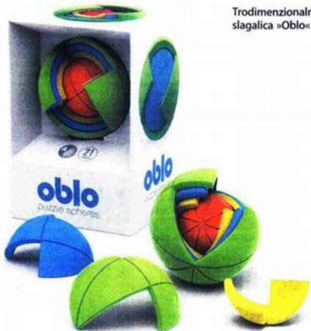
Trodimenzionalna slagalica »Oblo«