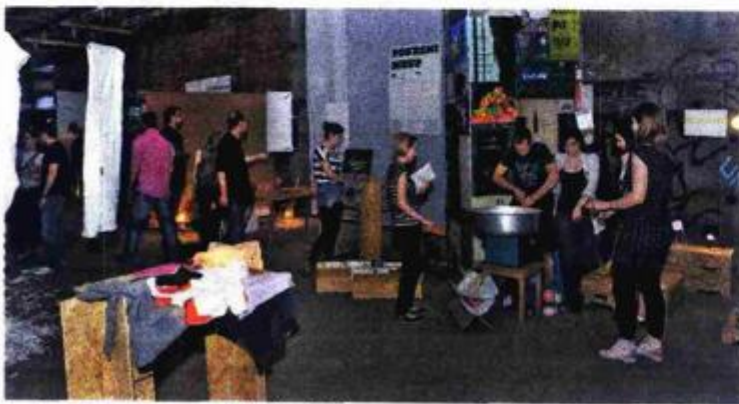
Sad i nekad: Suvremeni dizajn, šećerna vata, mjehurići od sapunice, gumi-gumi i školica

U sekciji D market, prodajnom dijelu Sajma, gdje su posjetitelji mogli kupiti primjerke hrvatskog proizvodnog dizajna, nagrada je pripala osječkom brendu Lega-lega, inteligentnom i zabavnom dizajnu majica, papirne galanterije i upotrebnih predmeta s prepoznatljivim osječkim predznakom.